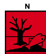
PELIGROSO PARA EL MEDIO AMBIENTE

Esta información se complementa con recomendaciones de seguridad y consejos referidos a su empleo